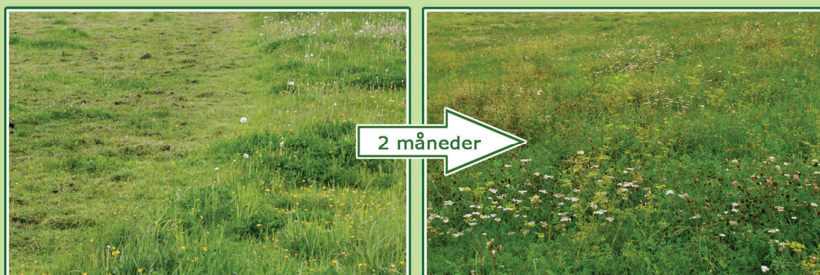
Området har været afgræsset i en måned og herefter frahegnet i to måneder. Dyrene får her frisk græs til den sidste del af sæsonen, når de igen lukkes ind.

Ved at hegne mindre områder fra i 1-2 måneder med et midlertidigt hegn - eller skifte mellem folde, kan engplanterne nå at blomstre. Og naturplejerne og andre kan nyde synet. Blomsterne er samtidig til gavn for insektlivet. Korrekt planlagt frahegning giver også mulighed for, at de arter, man gerne vil have til at brede sig, kan nå at sætte frø. Men dyrene skal have adgang til arealet igen inden sæsonens afslutning. Ellers kan mindre ønskede plantearter tage over.