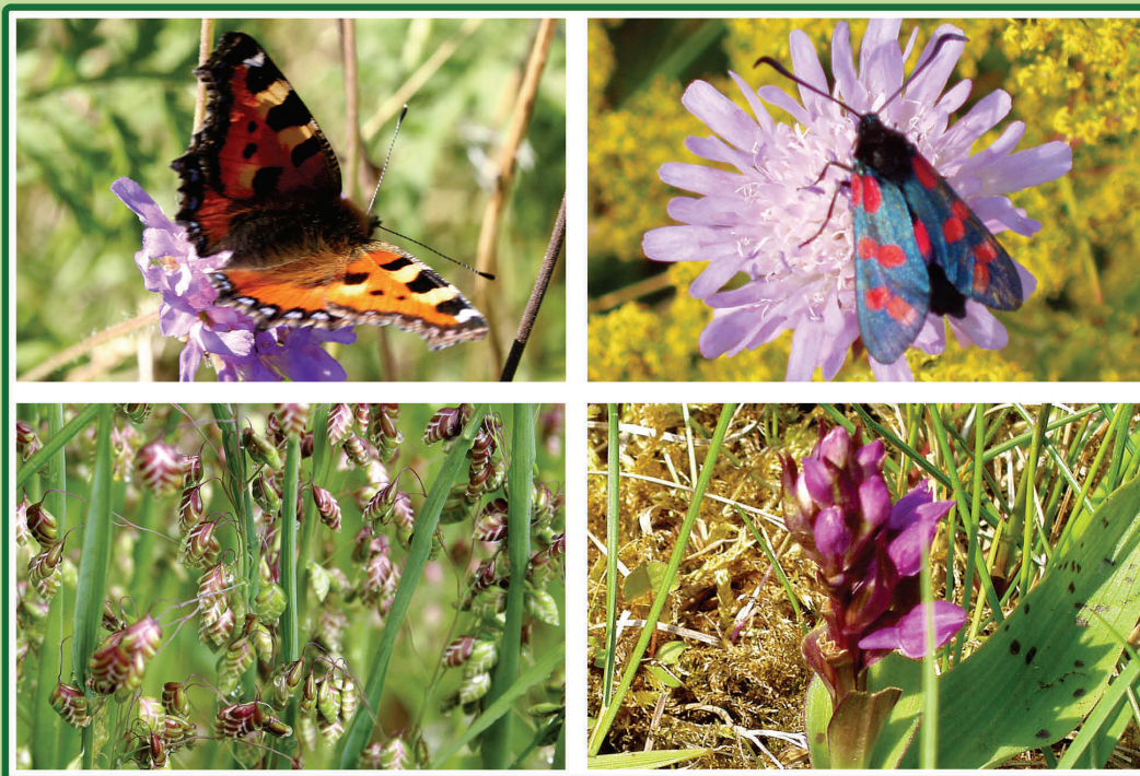
Naturplejerne får solen til at summe over engen. Her ringler hjertegræs om kap med insekternes summen, og maj gøgeurten er tryllet op af jorden.