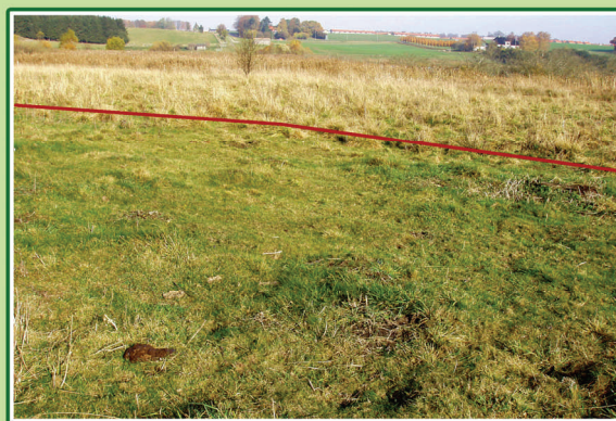
Feltet, der blev slået, er markeret med rødt. De græssende dyr har holdt mosebunke i skak resten af sæsonen.

Der har været praktiske forsøg i demofelter, som har givet medlemmerne en god indføring i, hvordan planterne og dyrene spiller sammen. Resultater fra demofelterne kan ses nedenfor og på www.natlan.dk .