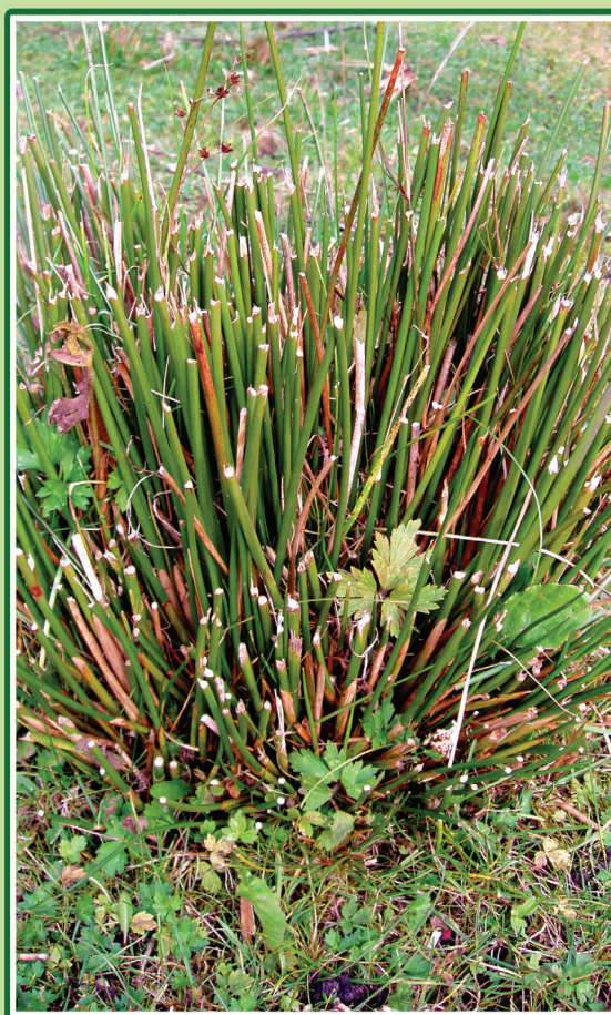
Lav ranunkel har her etableret sig og fået mulighed for at blomstre i en tue af lysesiv.