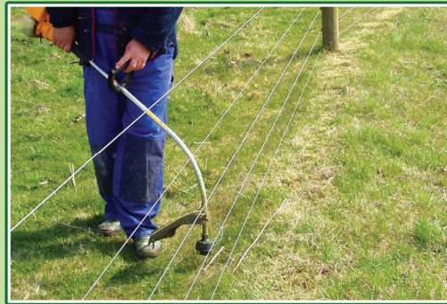
En af opgaverne er at slå græs under det elektriske hegn, enten med le eller, som her, med motorklipper.