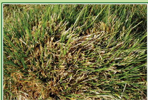
Nærbillede af græsset mosebunke efter slåning og afgræsning.

Der har været afholdt flere offentlige, guidede ture til foldene, hvor medlemmerne har lært om planterne og deres dynamik, og selv har fortalt om glæden ved at være med og om glæden ved at vide noget mere om naturen i de folde, der naturplejes.