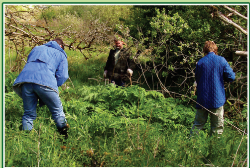
Naturpleje består også i at grave den invasive art, kæmpe bjørneklo, op. Det er vigtigt at kunne kende den fra andre arter i folden.