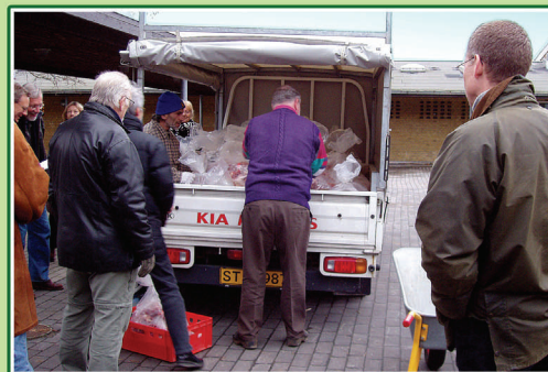
Landmanden henter dyrene, når græsningsæsonen er slut, og kører dem til slagteren. Når kødet er færdigmodnet, henter foreningen det hos slagteren.