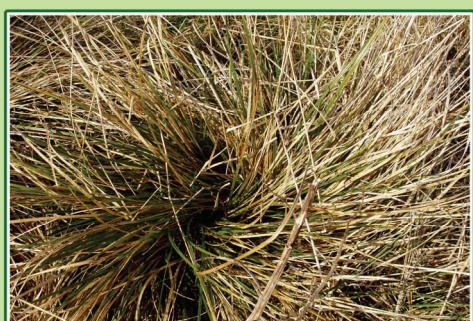
Dyrene rører næsten ikke de tuer af mosebunke, som ikke har været slået.

De tre græsningsselskaber, Hjortespring Naturplejeforening, Værløse Naturplejeforening – Koklapperne samt Slotsmosens Kogræsserselskab, har deltaget i et fælles to-årigt demonstrations-projekt finansieret af Direktoratet for Fødevarerhverv. I projektet er planterne i foldene blevet registreret, og medlemmerne har fået en god snak om, hvad der er vigtigt at holde øje med. Der er arter, som ønskes fremmet, og andre arter, som ikke må tage overhånd. Det er medlemmerne nu i stand til at klare på egen hånd.