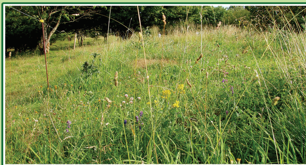
Når græsning udelades i en del af folden i et par måneder, kan man se mange af planterne blomstre.