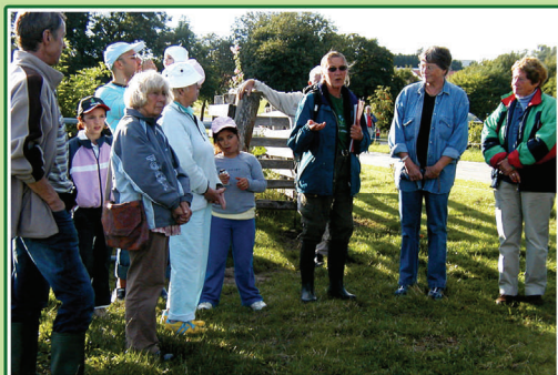
Der opleves og læres om græsning og natur på guidede ture.