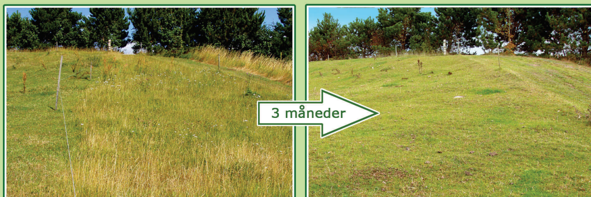
Området har haft græsningspause i to måneder midt på sommeren og herefter afgræsset resten af sæsonen. Dyrene har ved sæsonens afslutning græsset alt ned og fordelt frøene i folden.