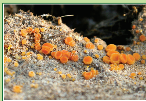
Svampefloret præger områderne om efteråret. Her omsættes en kokasse.