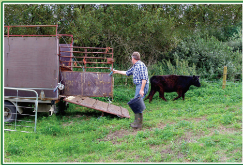
Landmanden kommer med dyrene om foråret og henter dem igen efter græsnings-sæsonen for at køre dem til slagteren.