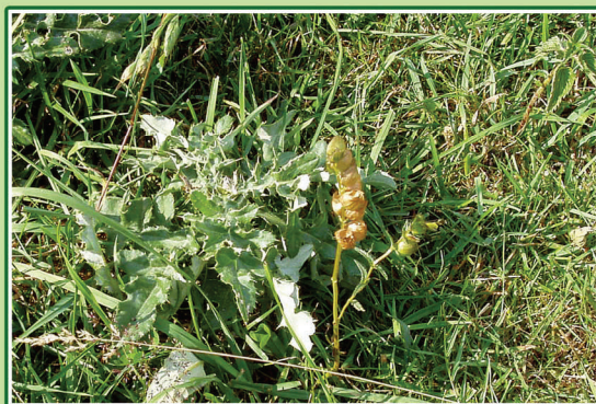
Liden skjaller har her etableret sig i ly af et skud af agertidsel. Den enårig art når her at sætte frø til næste års planter.

Det er vanskeligt for nye engblomster at etablere sig, når naturen i en årrække har været uplejet. Selv når der er naturplejet, kan det være vanskeligt for planterne at etablere sig, da dyrene også æder af de nye planter. Arter som lysesiv og agertidsel kan være et problem for andre engplanter, hvis de forekommer dominerende. Når de forekommer mere spredt, kan de dog hjælpe andre arter med etablering. De kan nemlig være ammeplanter: De nye planter spirer og etablerer sig i ly af dem, fordi dyrene ikke græsser så tæt her.