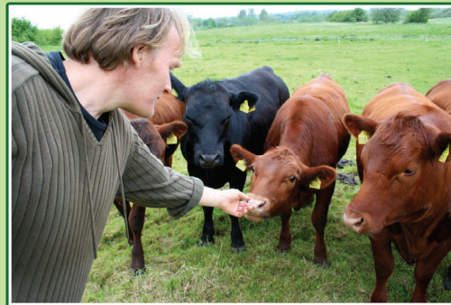
Tilsyn med dyrene går på skift mellem medlemmerne. Det er afstressende at komme ud og få en snak med dyrene.