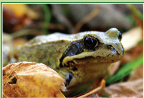
Folden overlades efter græsning til den øvrige natur og naturturister, her den butsnudede frø på vej i vinterhi i eller ved folden.