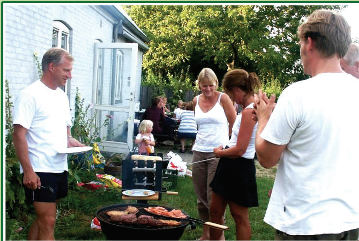
Græsningselskaberne byder på mange sociale oplevelser i løbet af sommeren.